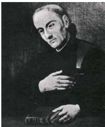
Juan de Ugarte.